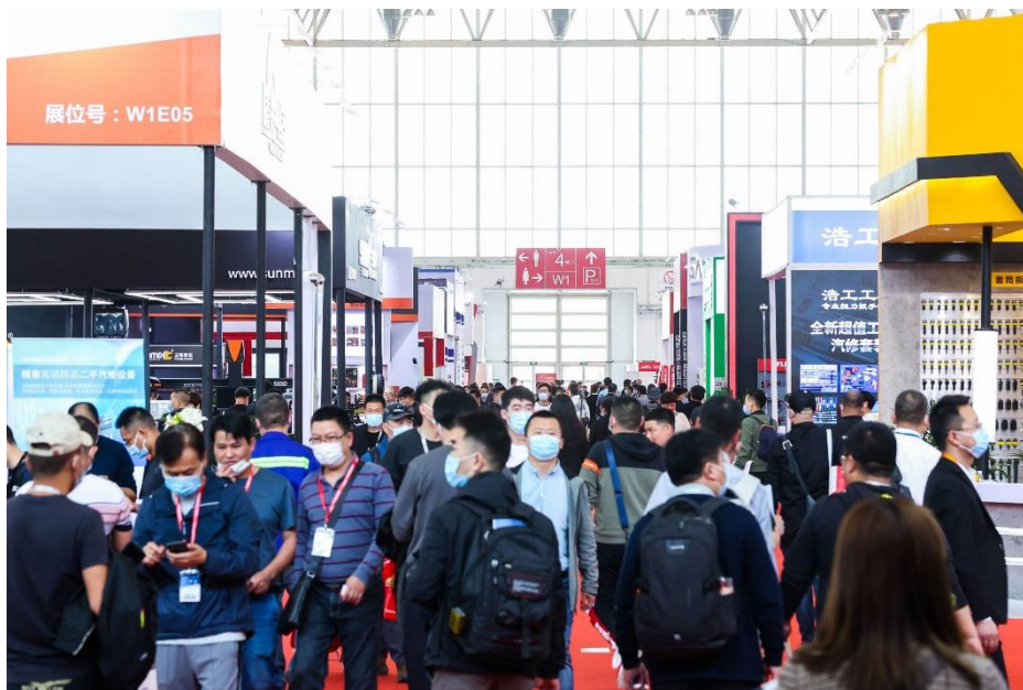
AMR 2021 展会特写

法兰通联展览（北京）有限公司 中国北京市朝阳区望京园 601 号 悠乐汇 E 座 1202 室